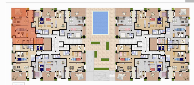
imagen no contractual